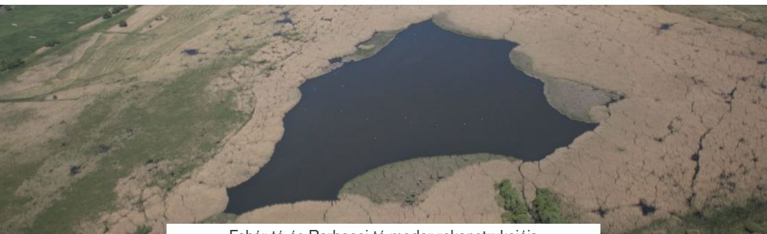
Fehér-tó és Barbacsi-tó meder rekonstrukciója